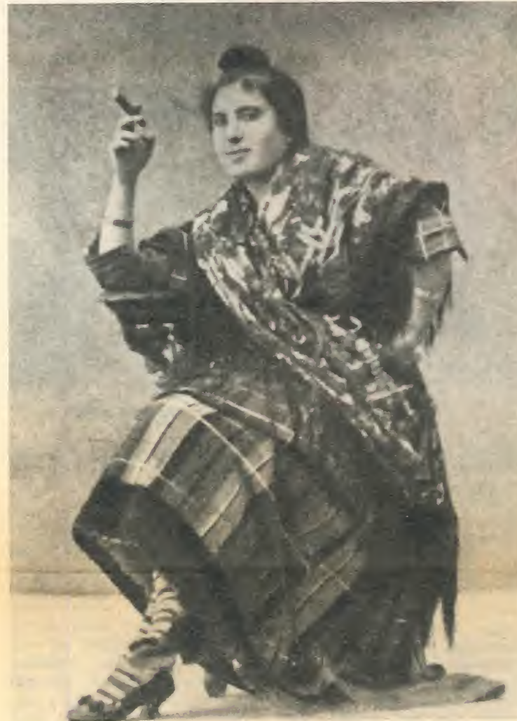
Pepa de Oro, una popular «cantaora» de la época, de quien se dice que enseñó a Antonio Chacón los cantes llamados de «ida y vuelta».